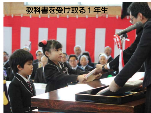
教科書を受け取る1年生

今年度も「あいさつ・なかよし・げんき学校」を合い言葉に、教職員、子ども達、保護者の皆様と信頼を