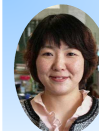
特別支援アシスタント

緑豊かな素敵な環境の中、素直で明るい子どもたちと過ごす毎日を楽しみにしております。どうぞよろしくお願いいたします。